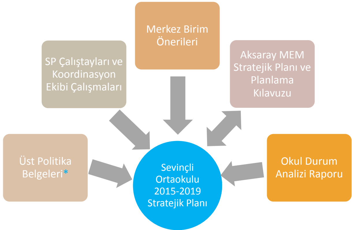
Şekil 1 Plan Oluşum Şeması